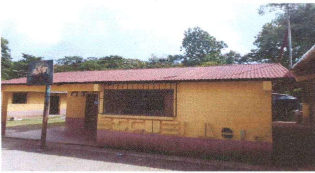
Foto 1: Se observa deterioro y oxidación de techo, desprendimiento de pintura en las paredes del modulo No. 1