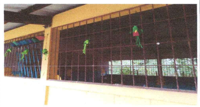
Foto 4: Se observa deterioro en los balcones de los modulos No. 1, 2 y 3.