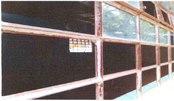
Foto 3: Se observa vidrios quebrados y faltantes en el módulo 2 y 3